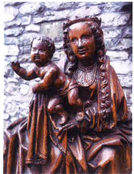
Hunnegem krijgt na het einde van de godsdienstoorlog in de jaren 1590 een nieuw devotiebeeld. De Gentse bisschop Van Looy geeft het origineel naar aanleiding van de verkoop in 2008 in voorlopige bewaring in de dekenij. Sinds kort wordt dat tentoongesteld in de schatkamer van de Sint-Bartholomeuskerk. Maar de parochie is geen eigenaar. De enige plek waar dit beeld thuis hoort, is de Hunnegemkerk waar het meer dan vierhonderd jaar door talloze bedevaarders is vereerd. Daar staat nu een kopie.

Maar er is meer aan de hand. Die overheveling vindt plaats tegen de achtergrond van de Gregoriaanse hervorming . Onder de leiding van de paus wil die restauratiebeweging na eeuwen van normvervaging, onder