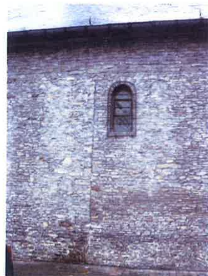
De bouwnaad tussen de eerste en de tweede bouwfase van de Hunnegemkerk.

Na de toekenning van de keure, die heel wat voorrechten inhoudt, verhuizen veel landarbeiders naar de nieuwe stad in wording. Omdat door die snelle bevolkingstoename het Romaanse kerkje al vlug te klein is, wordt dat kort na 1068 uitgebreid. Religie staat immers centraal in de toenmalige samenleving. Door het samenvallen van kerk en staat voelen de gezagsdragers zich tegenover God verantwoordelijk voor hun onderdanen, wat ook hun actieve inmenging in religieuze aangelegenheden verklaart.