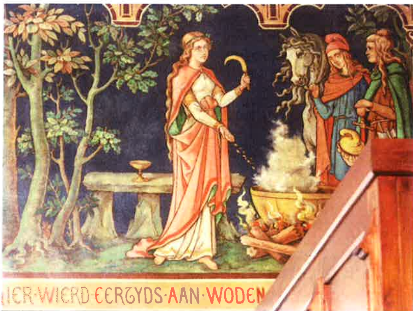
De 19de-eeuwse historieschilder Louis Bert de l'Arbre deelt de mening dat Hunnegem een heidense sacrale plaats is. In zijn fantasie brengt de Germaanse oppergod Woden (Wodan) offers. (Schildering kerk Hunnegem)

De toewijzing aan Amandus betekent dat Livinus, de legendarische heilige die in Sint-Lievens-Houtem ligt begraven, hier niet werkzaam is geweest. De argumenten van Bonifacius, de auteur van de eerste Vita van Livinus, en de Bollandist Joseph Ghesquière die worden overgenomen door de 19de-eeuwse geschiedschrijver De Portemont, 8 missen overigens overtuigingskracht.