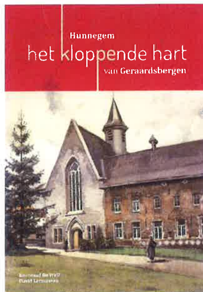
De kaft van het boek over Hunnegem

Historici en heemkundigen, zowel professionelen als amateurs, banen zich, vaak zeer gedreven, een eigen weg langs de flanken van dezelfde berg. Onderweg lezen zij dezelfde boeken en gebruiken dezelfde methodieken. En hoewel geestesgenoten, verschillen zij soms fundamenteel van mening. De bijwijlen bitse strijd over wie nu het grote gelijk aan zijn kant heeft, is vooral bedoeld om het eigen ego te strelen, maar raakt niet de kern van de zaak. Want die verschillende visies zijn normaal, omdat wie een andere flank van de berg beklimt, er vaak letterlijk een andere kijk op nahoudt. Overigens vormt die verscheidenheid de grootste rijkdom van de geschiedenis. Eenieder vertelt 'zijn' waarheid, want niemand heeft 'dé waarheid' in pacht. Bovendien is bescheidenheid de enige correcte basishouding. Want iedere auteur zorgt via zijn publicaties voor het optrekken van slechts een deel van die nevel waarin de top van de berg gehuld blijft. Want het bereiken daarvan blijft een illusie.