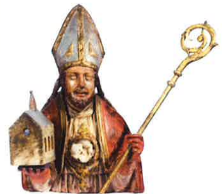
De 65 cm hoge reliëkbuste van Amandus uit de 18de eeuw. De relikven van de heilige die ook Geraardsbergen heeft gekerstend, zijn ruim verspreid. (Kunstverzameling priorij Hunnegem)