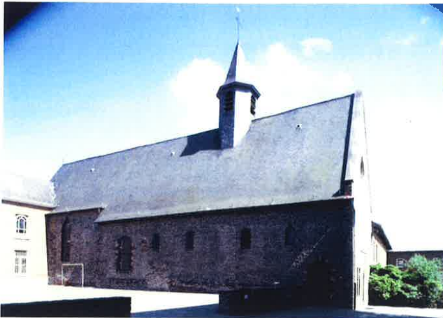
De parel van Hunnegem: de nog originele Romaanse kerk. Het koor wordt door de aanbouw van een haakse vleugel in 1860 gedeeltelijk vermindert.