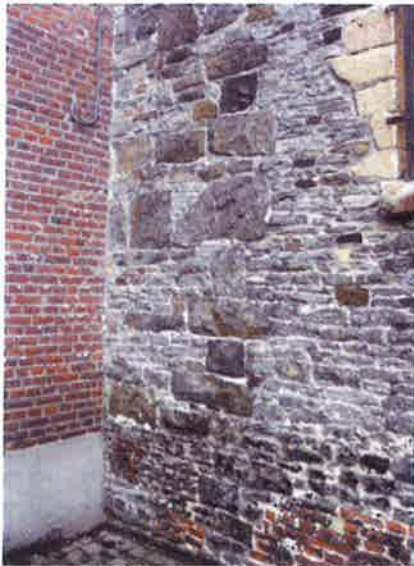
De langsgevel van het Romaanse koor bevat massieve blokken steen ter hoogte van de aanbouw van de vleugel in 1860. Hier zijn de bouwlagen zichtbaar. Dat de muur bij gebrek aan materiaal soms minder dan een halve meter wordt opgetrokken, bewijst dat de constructie vele jaren heeft geduurd.

grootste eenbeukige kerk is van Oost-Vlaanderen, komt die wegens onbegrijpelijke redenen niet aan bod komt in de studie van Antony Demey. Volgens hem is de kerk van Rozebeke (Zwalm) de grootste. 22 Dat schip meet binnenwerks 19,75 meter. De Hunnegemkerk is 60 cm groter.