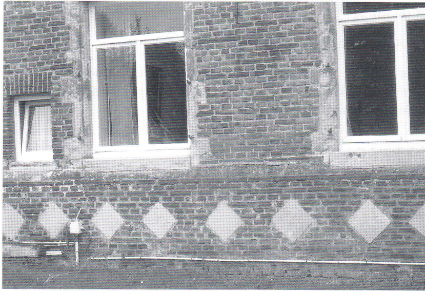
Algemeen overzicht van de in de muur ingemetselde grafstenen.

gevestigd, evenals enkele hospitaalzusters. 8 Voortaan kregen de zusters een eenvoudig metalen kruis, waarvan enkele exemplaren, dankzij de alertheid van onze vriend en collega, Marcel Cock, van de sloop gered zijn. Het stadsbestuur verbood, als gevolg van de strijd tussen katholieken en liberalen, in januari 1880 tijdelijk de lokale begrafenis van de zusters uit beide kloosters. Vrij vlug werd het begrafenisrecht hersteld en dit bleef geldig tot wanneer Hunnegem op de plaats van dit kerkhof in 1963 nieuwe klassen ging bouwen.